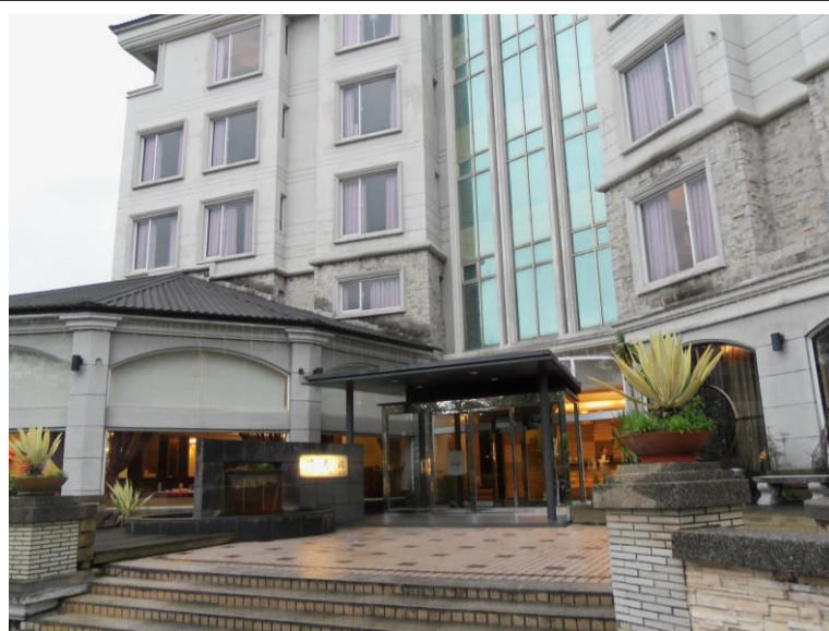
2014.3.7：新竹青草湖畔的煙波大飯店