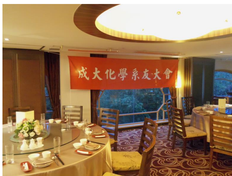
2014.3.7：成大化學系友大會於新竹青草湖畔之煙波大飯店舉行

西元 2014 年的化學系友大會，在新竹青草湖畔的煙波大飯店舉行，歲月匆匆，不覺那已經是十一年前的事情。回首往事，不勝唏噓。